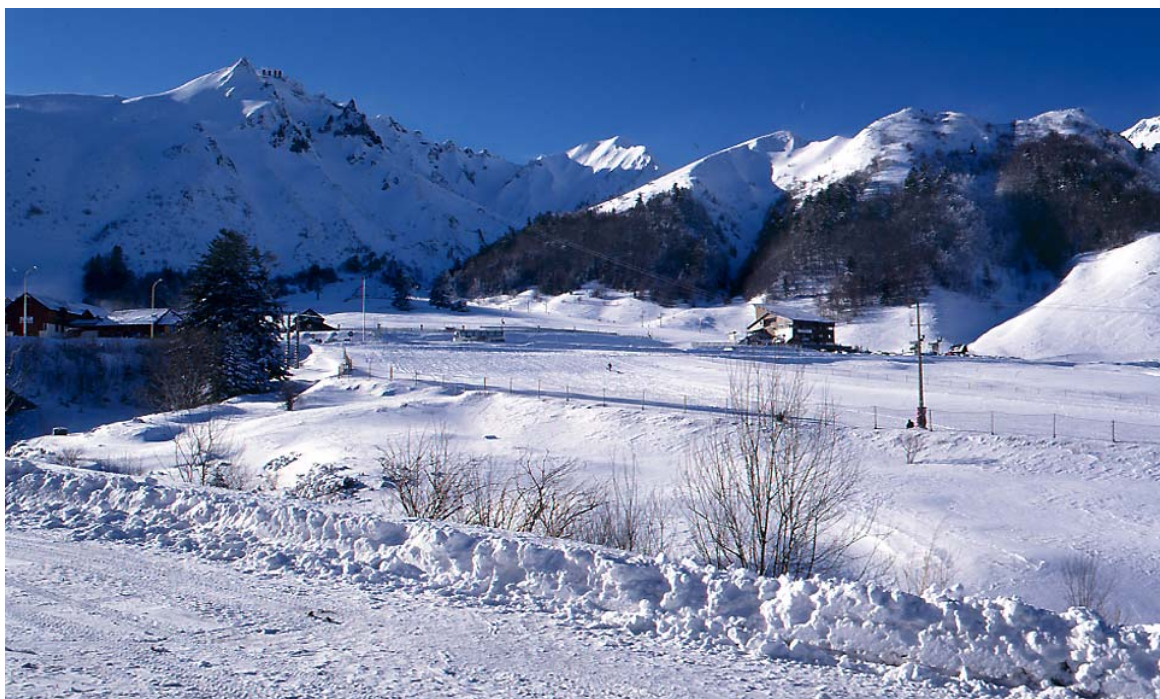
Rochefort-Montagne. Vue partielle du massif du Sancy enneigé. R. Choplain ; Phot. Inv. R. Maston

Sur la dizaine de stations thermales que compte l'Auvergne, six sont implantées dans le département du Puy-de-Dôme. Toutes ne sont pas nées sous les mêmes auspices, toutes n'ont pas connu la même fortune. Mais qu'il s'agisse de La Bourboule, Châteauneuf-les-Bains, Châtel-Guyon, Le Mont-Dore, Royat ou Saint-Nectaire, le développement de ces villes est toujours lié à la présence première de l'eau, à la résurgence de sources minérales, parfois chaudes, parfois gazeuses.