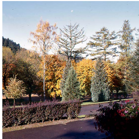
Rochefort-Montagne, La Bourboule, Vue partielle du parc Fenestre.

On remarque le même phénomène à Royat, dont la partie haute de la ville thermale, en contrebas du vieux bourg, se lotit entre 1880 et 1914 : villas de médecins et leurs parcs contribuent là encore à l'émergence d'un nouveau quartier.