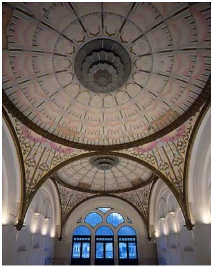
Rochefort-Montagne, La Bourboule, Vue générale des coupoles du grand hall du casino.