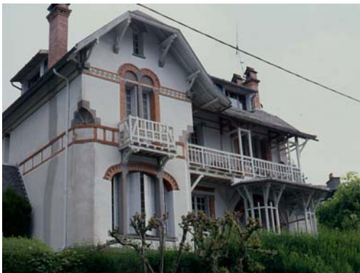
Rochefort-Montagne, La Bourboule, villa Ker d'Or, ancienne villa Sunnybank.

Rassemblés d'abord au plus près de l'établissement thermal par égard pour la santé du curiste (au Mont-Dore, la place du Panthéon est presque exclusivement dédiée, à l'origine, à la construction d'hôtels), ils gagnent peu à peu des quartiers plus excentrés, rejoignant les villas et les équipements de loisirs qui dans le même temps s'installent aux abords des stations. Car il convient aussi de loger médecins, propriétaires d'hôtels, directeurs de casinos et autres acteurs de la vie thermale. On voit ainsi se constituer de véritables quartiers résidentiels, aux abords des parcs, promenades et lieux festifs nouvellement créés.