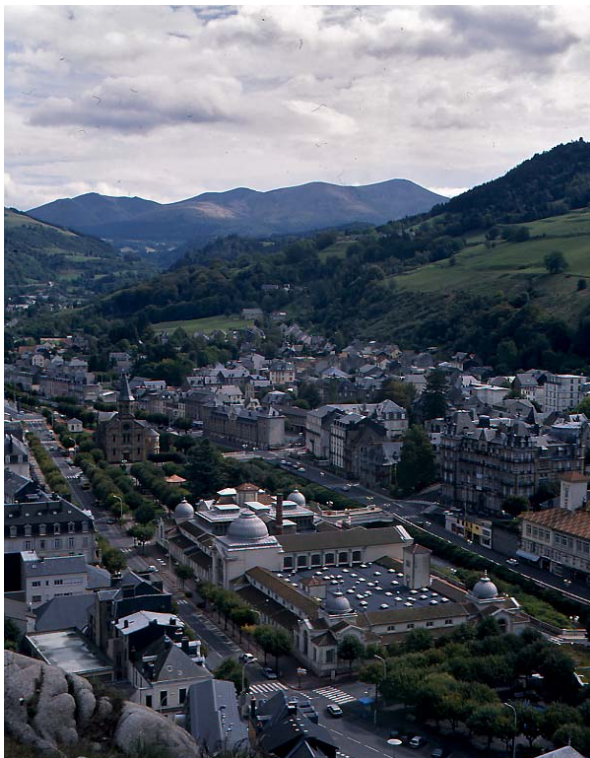
Rochefort-Montagne, La Bourboule, Vue générale sur les Grands Thermes depuis le nord-ouest.

Mais le plus remarquable dans cet exemple est la vision d'urbaniste de Ledru, qui ne se contente pas de créer un objet luxueux au centre du village. Il rêve, dès ses premières esquisses, de tout un développement urbain, d'abord destiné à mettre en valeur l'édifice, mais qui très vite va donner naissance à une véritable ville. En à peine un siècle, à partir de quelques tracés de places, de rues et de quelques sévères prescriptions d'alignement, on assiste à la complète transformation et à l'extension du lieu, qui échange ses maisons à toit de chaume contre hôtels et immeubles dignes de nombre de villes d'eaux de l'époque.