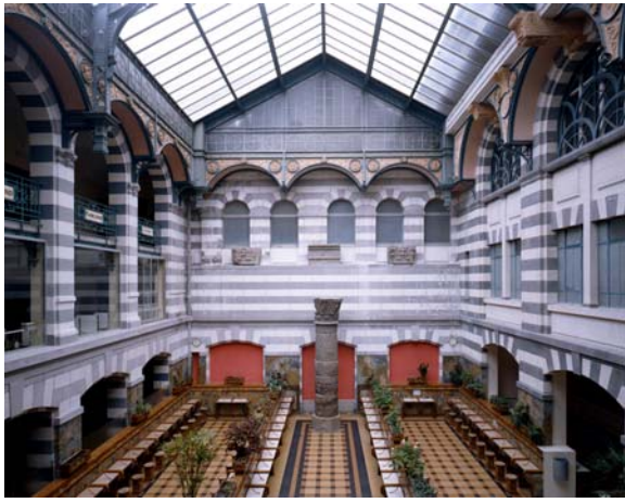
Rochefort-Montagne, Le Mont-Dore Etablissement thermal, Vue générale de la salle des inhalations de gaz thermaux, au rez-de-chaussée.