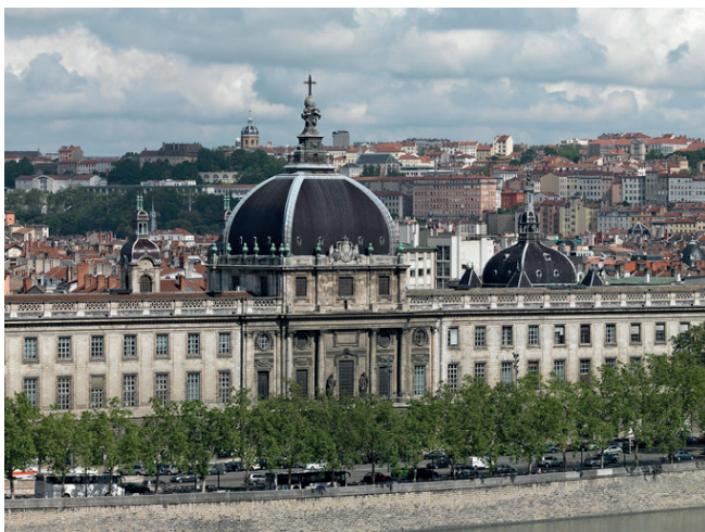
Hôtel-Dieu, Lyon

L'Inventaire général du patrimoine culturel, créé en 1964 par André Malraux, est un service de recherche et de documentation décentralisé en régions .