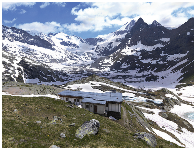
Refuge des Evettes, Haute-Maurienne, Savoie

Photographie couverture : Chapelle de la Trinité, Lyon